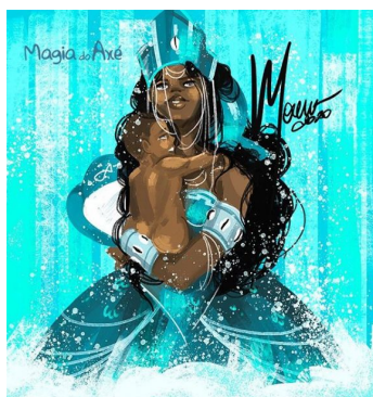
FIG. 3 – IEMANJÁ