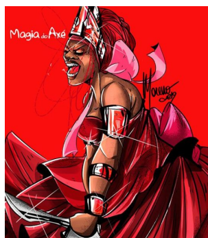
FIG. 2 – IANSÃ