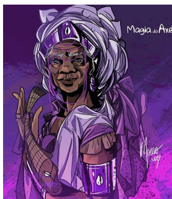
FIG. 1 – NANÃ