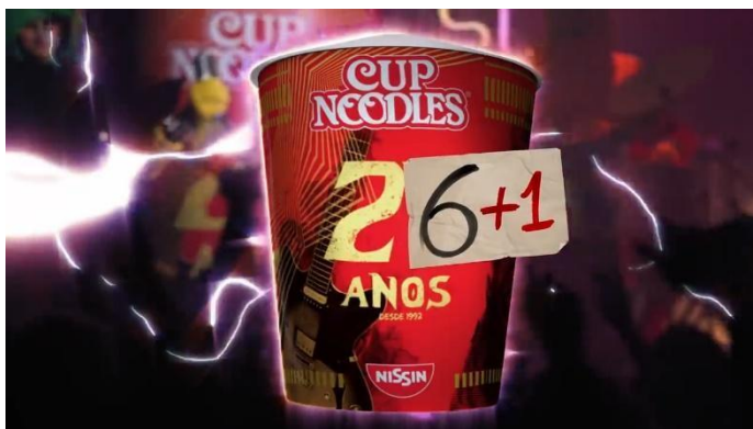
FIG 12 – ETIQUETA COM A ESCRITA “6+1” SOBREPONDO O NÚMERO 7 NA EMBALAGEM: