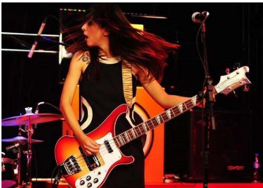
FIG 6C – FLAVIA COURI, EX-BAIXISTA DA BANDA AUTORAMAS E FIG. 6D - GENE SIMMONS, BAIXISTA DA BANDA KISS, COM LÍNGUA PARA FORA:

https://www.tenhomaisdiscosqueamigos.com/2016/04/10/ex-baixista-do-hole-fala-sobre-reuniao-do-grupo-e-festivais-atuais/