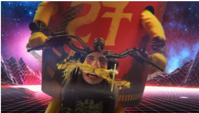
FIG 9 – CUP NOODLES PILOTANDO UMA HARLEY DAVIDSON: