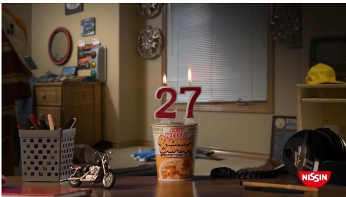
FIG. 1 – PRIMEIRA AMBIENTAÇÃO DO VÍDEO: