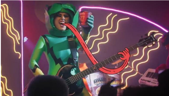
FIG. 6A – BAIXISTA TOCANDO SEU INSTRUMENTO COM A LÍNGUA DE FORA E FIG. 6B – MELISSA VAUF DER MAUR, EX-BAIXISTA DA BANDA THE SMASHING PUMPKINS: