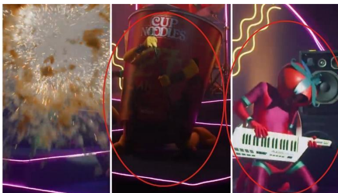
FIG 11 – POSE COM JOELHOS NO CHÃO: