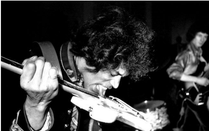
FIG 7 – JIMI HENDRIX TOCANDO GUITARRA COM A LÍNGUA: