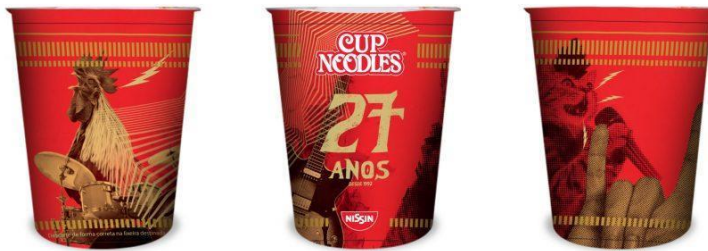
FIG. 2 - EMBALAGEM COMEMORATIVA CUP NOODLES: