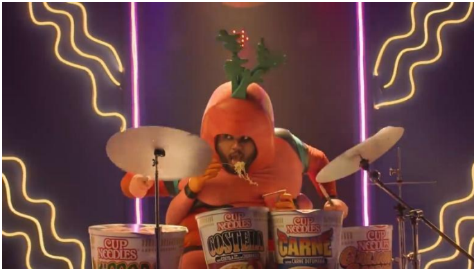
FIG. 5 – BATERIA FEITA COM OS PRODUTOS CUP NOODLES: