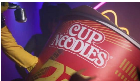
FIG. 4A – REPRESENTAÇÃO DOS ARTISTAS E FIG. 4B - FREDDIE MERCURY SEGURANDO MICROFONE:

É possível perceber, também, as movimentações de palco dos instrumentistas, que são usados por artistas do estilo, posições de apresentação, trejeitos... Uma ênfase na nova embalagem de Cup Noodles como vocalista, carregando o microfone (figura 4A) da forma que alguns dos vocalistas do estilo usam, como Freddie Mercury (figura 4B) – da banda Queen – onde elevam, não somente o microfone, mas sim todo o pedestal, utilizando como forma de expressar sua interpretação da música. Aqui é perceptível o uso de referências dos arquétipos dos artistas, uma vez que na peça audiovisual as movimentações são uma representação das que acontecem na realidade, que também influenciam novos artistas.