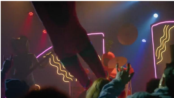
FIG. 10 – SALTO DO PERSONAGEM TOMATE PARA A PLATEIA: