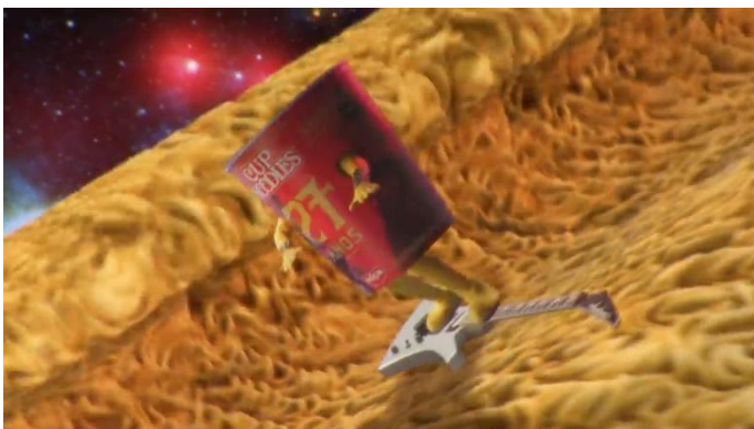
FIG 8 – CUP NOODLES SURFANDO EM UMA GUITARRA MOCKINBIRD: