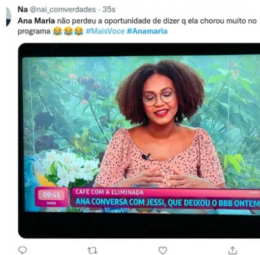
FIGURA 1: memes de Jessilane continuavam a repercutir no Twitter