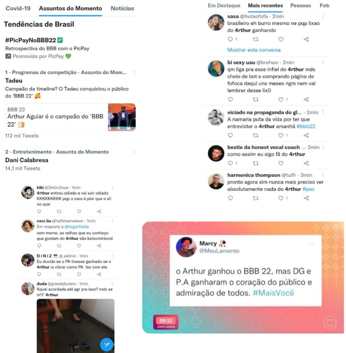
Figura 3 - O que repercutiu no Twitter no dia 26 de abril de 2022 / tweet lido e exibido por Ana Maria no Mais Você

quantidade de informações ofertadas pela internet potencializa a interação do público que expõe suas opiniões e disseminam entre outros usuários da rede. Fãs de Arthur Aguiar demonstraram o seu apoio ao vencedor, enquanto os rivais defendiam PA e Douglas Silva (DG), por terem conquistado o coração do público. Este tweet , inclusive, foi lido no programa Mais Você (figura 3).