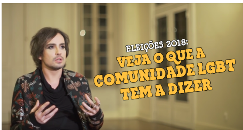
Figura 2: Eleições 2018: Veja o que a comunidade LGBT tem a dizer

Se colocando na linha de frente de luta dos movimentos da comunidade LGBTQIAP+ a marca fortaleceu seu relacionamento com essa parcela social a Ben & Jerry's passou de ser uma marca apoiadora e ser uma representante das pautas em meio a sociedade, o que de acordo com Santos (2019) construiu a imagem da marca de agente de mudanças.