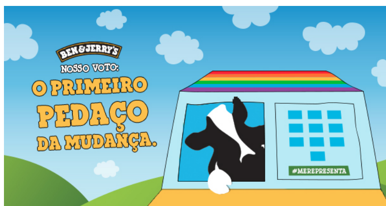
Figura 1: Nosso voto: o primeiro pedaço da mudança

apresentar a importância da representatividade LGBTQIAP+ no legislativo brasileiro, encorajando o pensamento e a reflexão a respeito do uso do voto e instruindo maneiras de identificar candidatos que poderiam vir a ser aliados na construção do espaço e voz que as causas demandem.