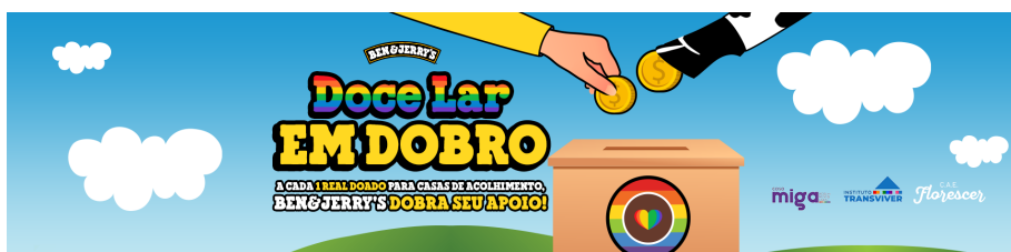
Figura 3: Lar Doce Lar em Dobro

peças LGBTQIAP+ em situação de desfavorecimento social - que fora constatado pela ONG Vote LGBT que essa parcela social fora uma das mais afetadas durante a pandemia por perderem contato com suas redes de apoio e serem expulsas de casa por serem quem são. O projeto arrecadou R$60mil que foram divididos igualmente entre as casas que receberam as doações o que segundo Aguiar (2018) é um apontamento que as marcas devem fazer quando uma ação social desse modo se encerra: mostrar em dados sólidos quais foram os benefícios alcançados pelo movimento utilizado na ação e quão significativo estes foram para o grupo.