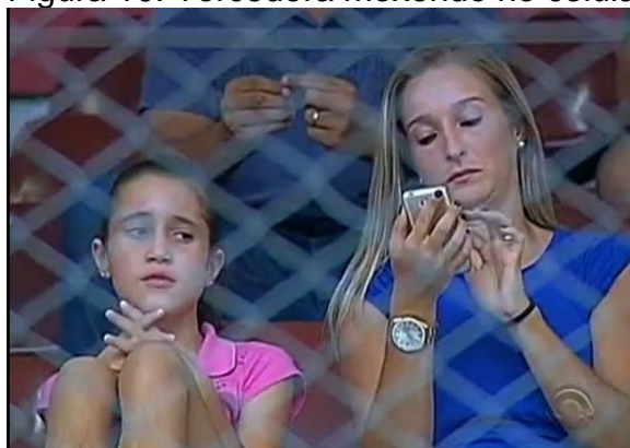
Figura 10: Torcedora mexendo no celular.

Neste episódio, 19 torcedoras aparecem, com a trilha ao fundo. A presença da mulher no futebol representa ameaças para as construções de gênero, “ameaça porque chama para si a atenção de homens e mulheres, dentro de um universo constituído e dominado por valores masculinos e porque põe em perigo algumas características tidas constituídas da sua feminilidade” (GOELLNER, 2006, p. 89).