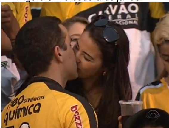
Figura 5: Torcedora beijando.