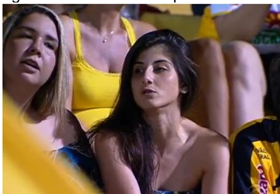
Figura 7: Torcedoras na partida de futebol.