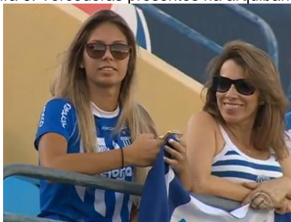
Figura 6: Torcedoras presentes na arquibancada.

Esse cenário contribui para o futebol continuar sendo predominantemente masculino, pois as torcedoras são representadas para os homens, e não para elas mesmas. Goellner (2005, p. 143) explica essa dissociação da figura feminina com o esporte, “entre o futebol e a masculinização da mulher e naturalização de uma representação da feminilidade que estabelece uma relação linear e imperativa entre mulher, feminilidade e beleza”.