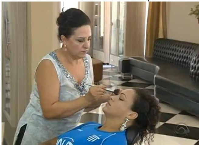
Figura 1: Torcedora recebendo dicas para se arrumar.