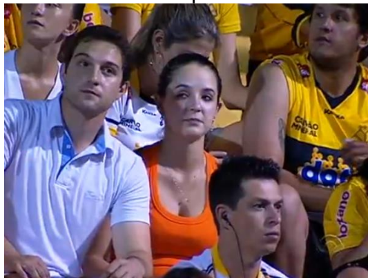
Figura 8: Torcedora acompanhada de um homem.

Por isso, é comum que as mulheres apareçam, apenas como mediadoras dos debates, acompanhantes de namorados ou marias-chuteiras (COSTA, 2007), como é observado nas imagens 8 e 9. A figura da mulher no jornalismo esportivo fortalece a ideia de que elas não entendem de táticas, desempenho e regras do esporte.