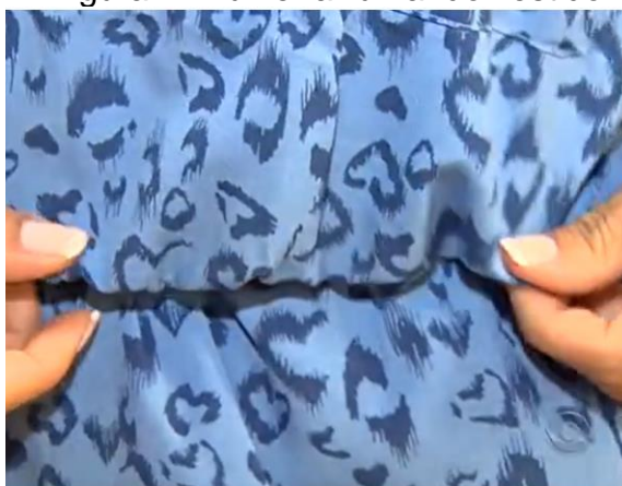
Figura 4: Mulher arrumando vestido.