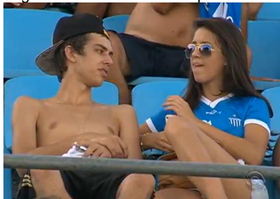
Figura 9: Torcedora com rapaz ao lado