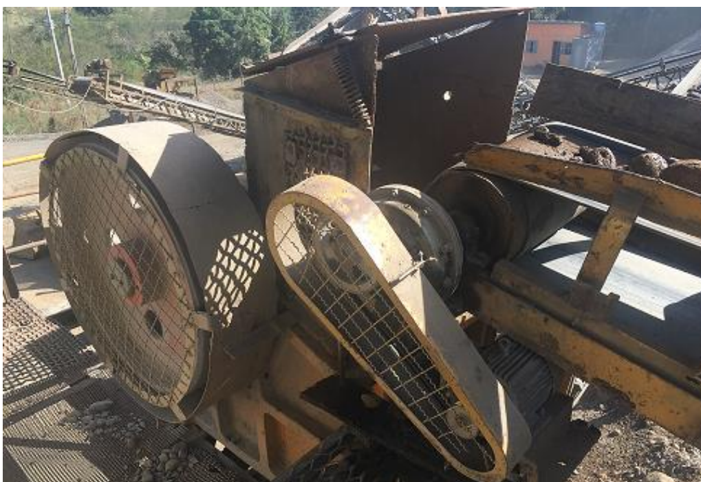
Figura 6 – Britador de Mandíbulas (Primário).

Sendo que, na unidade de britagem contém: um britador de mandíbulas (primário), correias transportadoras, um britador tipo cone (secundário), e uma peneira com dois decks, tendo a capacidade para o uso de telas com as granulometrias distintas.