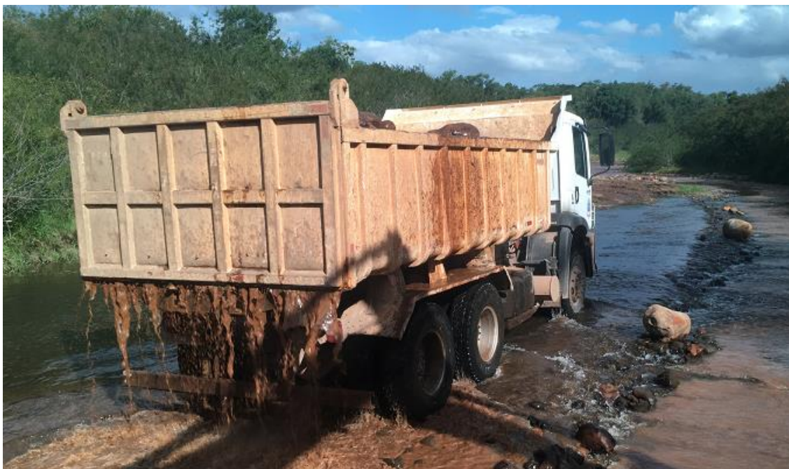
Figura 4 – Costellation 26-280 Saindo do Rio (Do autor, 2020).

Por isso, não foi diferente, também teve a necessidade de montar uma tabela com os lubrificantes adequados Tab. 3, filtros, e intervalo para repor a graxa.