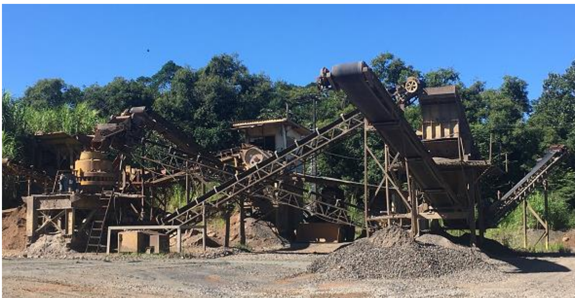
Figura 9 – Unidade de Britagem Completa.

Já a peneira, recebe o material processado pelo britador secundário, assim, separando a material que está com a granulometria desejada, ou seja, 1 polegada. Já o material que excede essa medida, acaba retornando para o britador secundário, para ser processada novamente até chegar na medida desejada.