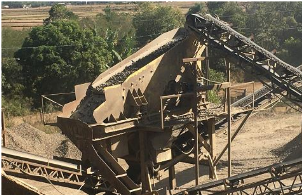
Figura 8 – Peneira de Dois Decks.

Já a peneira, recebe o material processado pelo britador secundário, assim, separando a material que está com a granulometria desejada, ou seja, 1 polegada. Já o material que excede essa medida, acaba retornando para o britador secundário, para ser processada novamente até chegar na medida desejada.