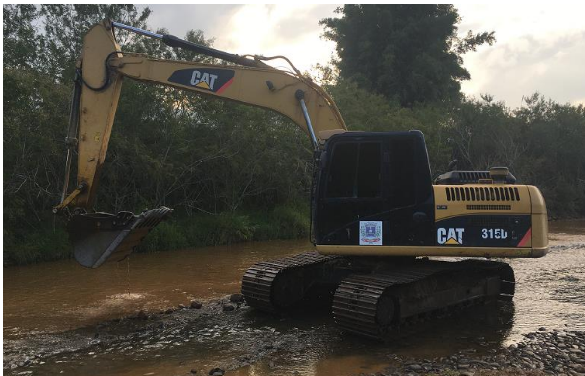
Figura 2 – Escavadeira Hidráulica Caterpillar 315 DL (Do autor, 2020).

Após observar as recomendações no catálogo do fabricante, foram criadas as seguintes. Veja a Tab. 1: