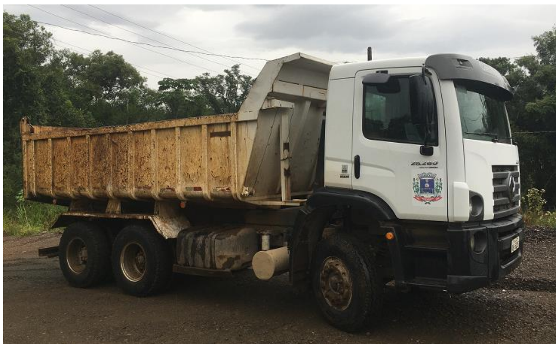
Figura 3 – Constellation 26-280.

O caminhão tem a finalidade de transportar o seixo da estação de carregamento no rio, até a unidade de britagem, para a alimentação do britador.