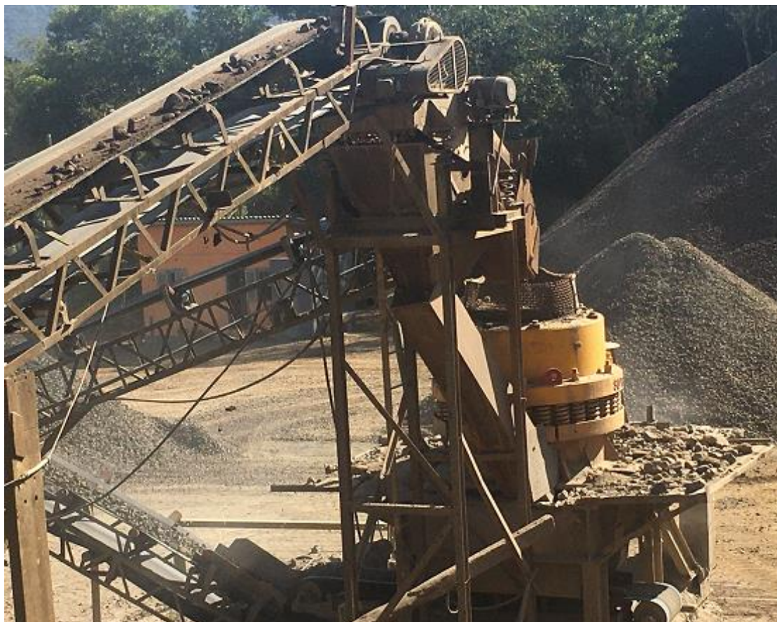
Figura 7 – Britador Tipo Cone (Secundário).

O britador secundário tem como função transformar o material processado pelo britador primário, em pedras britas de 1 polegada aproximadamente, para poder ser usada nas pavimentações.