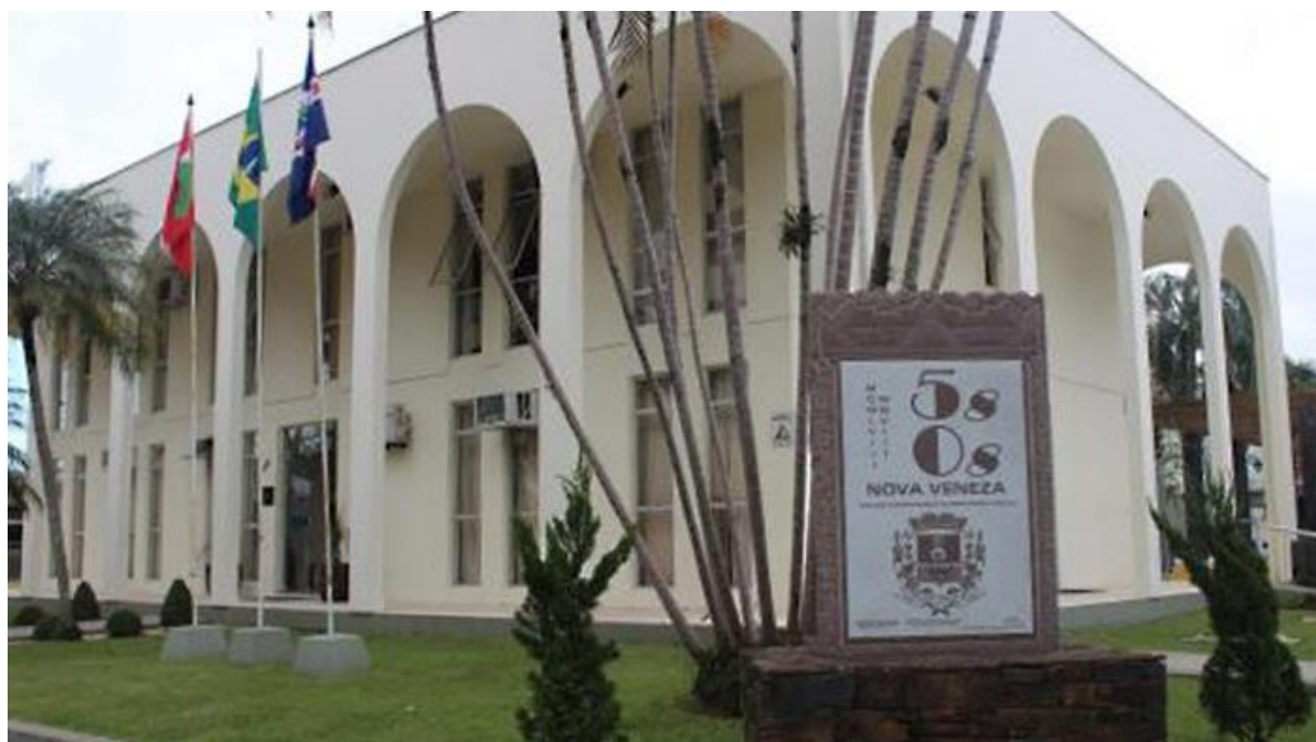
Figura 1 – Prefeitura Municipal de Nova Veneza/SC – Brasil.

Com o vasto progresso que vem acontecendo no município de Nova Veneza, a Secretaria de Obras é o órgão responsável em executar a política rodoviária de transportes do município, as obras públicas, a política de urbanismo e os serviços públicos municipais.