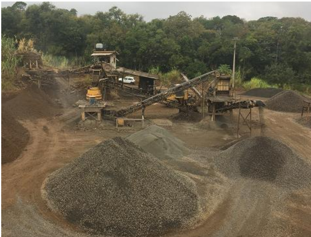
Figura 10 – Unidade de Britagem em Funcionamento.

A unidade de britagem trabalhando em produção total, chega a produzir em média 15 \text{ m}^3 por hora de pedra brita e na faixa de 10 a 13 \text{ m}^3 por hora de base, sendo que a base leva em consideração o seixo que vem do rio, quanto mais areia tiver em meio as pedras, maior o rendimento de base.