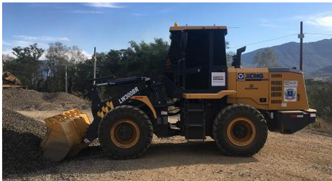
Figura 5 – Pá Carregadeira XCMG LW300BR.

as obras, sendo assim, com seu trabalho constante, necessitou de uma tabela com horário correto para a sua manutenção, para poder preservar o equipamento, e não parar a linha de produção por falhas mecânicas.