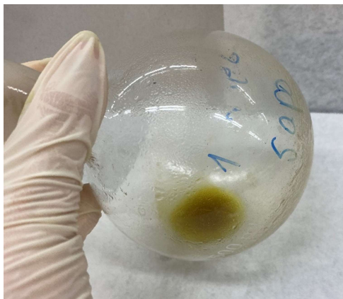
Figura 5: Rendimento Extração de Soxhlet.