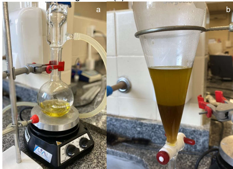
Figura 4: Produção de biodiesel (a) e separação de fases biodiesel e glicerina (b).

Ocorreu por fim a etapa de purificação, que consistiu na lavagem do biodiesel em três etapas. As lavagens foram feitas com a adição de 25 mL da solução aquosa de ácido clorídrico 0,5% (v/v), solução saturada de NaCl e água destilada, respectivamente. Foram agitadas por 5 min, deixadas em repouso para separação de fases e retirada a fase no próprio funil de separação. Após a finalização das etapas de lavagens, adicionou-se duas espátulas de sulfato de sódio para eliminar os vestígios de água que ainda poderiam ter restado. O biodiesel produzido foi armazenado em garrafa de vidro âmbar fechada para evitar exposição ao ar e luz.