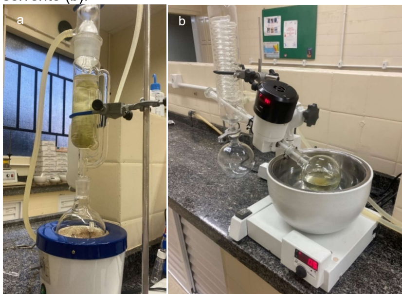
Figura 2: Extração por Soxhlet (a) e recuperação do solvente (b).

A partir do aquecimento do solvente no sistema, a entrada do seu estado de ebulição, e sua condensação, a extração se inicia como mostra o item “a” da Fig. 2. A extração foi mantida enquanto se observou a coloração amarelada no dedal de papel. Após o fim da extração, depois do seu resfriamento, filtrou-se a mistura, e levou-se a um rotaevaporador, para atingir a evaporação do hexano, que foi recuperado no balão de fundo de recolhimento, conforme demonstra o item “b” da Fig. 2. Quando não se observou mais a condensação do solvente, finalizou-se o processo e o óleo de abacate foi obtido.