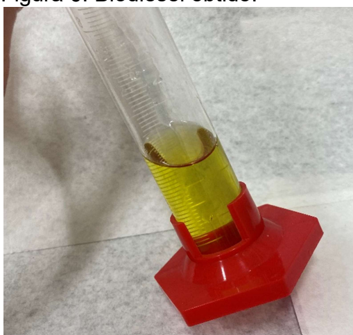
Figura 6: Biodiesel obtido.

Todos os resultados se mostraram satisfatórios ao serem comparados aos parâmetros da ANP, conforme apresentados na Tab. 2, indicando a eficiência da produção do biodiesel através da reação de transesterificação. Quanto ao aspecto, como observa-se na Fig. 6, o biodiesel produzido possui uma visualização límpida e isenta de impurezas.