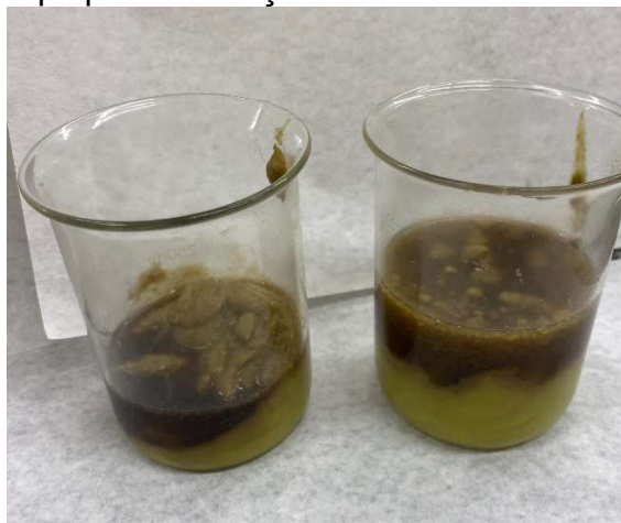
Figura 3: Separação de fases entre óleo e polpa na extração mecânica.

Adicionou-se cerca de 1200 g de polpa (batida e homogeneizada) em vários béqueres, e submeteu-se ao banho maria em torno de 50 °C, por um tempo de 2 h, mexendo lentamente. Posteriormente ao banho maria, separou-se a polpa em béqueres menores, com porções em cerca de 100 g. Após, deixou-se em repouso por 24 h. Observou-se a separação da fase do óleo em relação a polpa como mostra a Fig. 4. Quando o repouso acabou, coletou-se o óleo e filtrou-se em papel filtro para garantir a ausência de partículas sólidas.