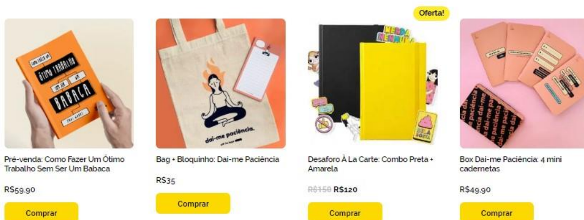
FIG. 2 - PRODUTOS E-COMMERCE AFF THE HYE