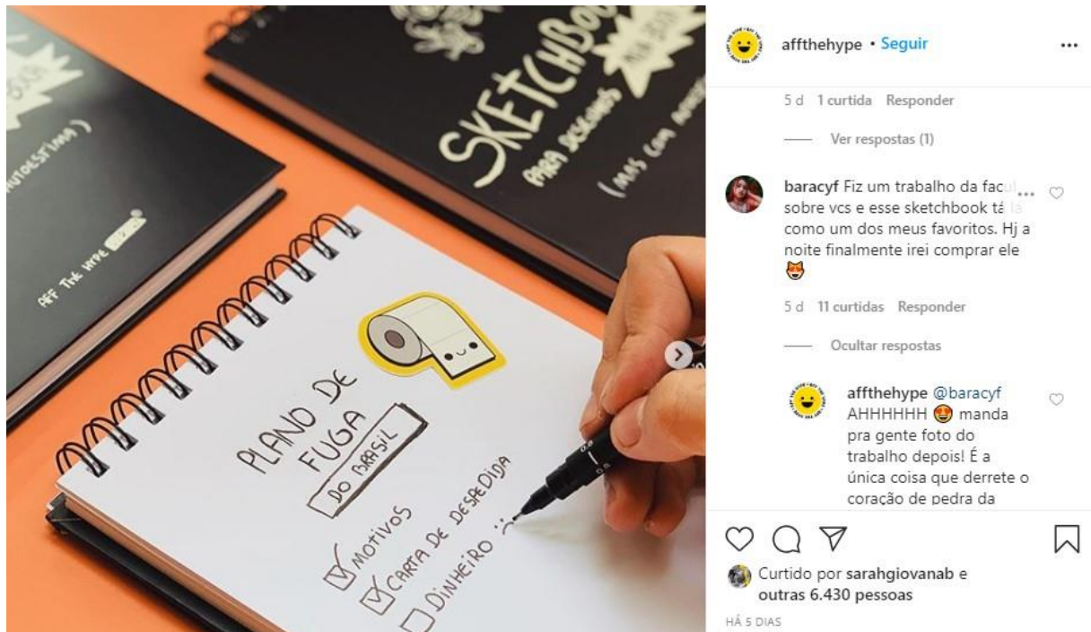
FIG. 4 - Interação em comentários no instagram

Fonte: Rede Social Instagram . Disponível em: < https://www.instagram.com/moca_do_marketing/ > Acessado em: 05 de Junho, 2020.