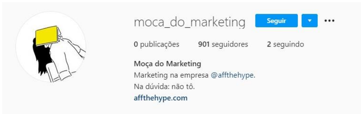
FIG. 3 - Instagram da Moça do Marketing