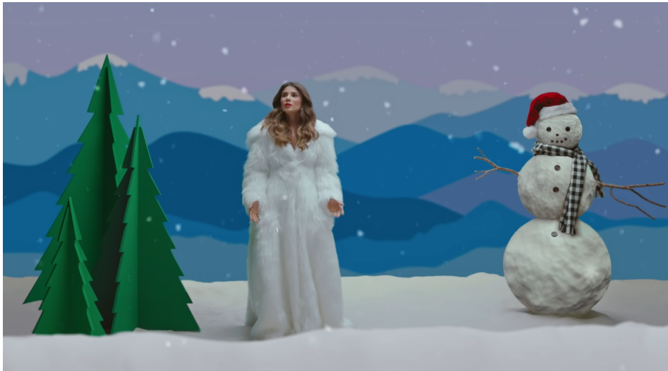
Figura 3: Natal fora do Brasil