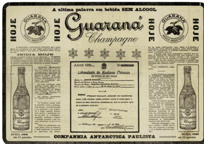
Fig. 1 - Anúncio Guaraná Antarctica