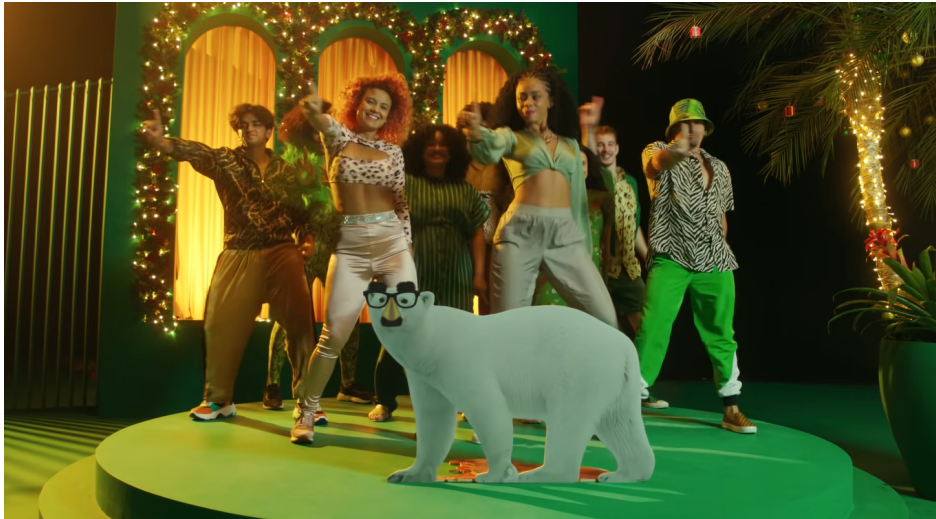
Figura 5: Imagem urso-polar

O comercial busca reforçar sentidos para certos signos presentes nas comemorações brasileiras contribuindo para a construção de um mapa simbólico do natal brasileiro de diversas formas, uma delas é a tentativa de exclusão da concorrência do imaginário popular, ainda que de forma descontraída e mascarada com referências à cultura pop . O verso “Aqui não tem urso, mas tem lobo guará” é acompanhado de elementos visuais, onde a imagem de um urso-polar (figura 5) dá lugar a imagem de um “vira-lata caramelo” (figura 6).