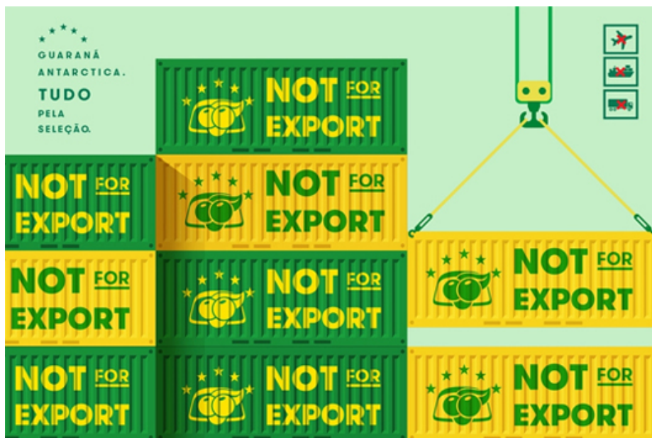
Fig. 2 - Anúncio da campanha “Tudo pela seleção”

Essa parceria resultou em diversas campanhas como a “Tudo pela seleção” para a Copa do Mundo FIFA de 2018, ano em que as exportações para 18 países que participaram do campeonato foram suspensas, conforme divulgado na figura 2. A ideia era privar os adversários da chance de provar o sabor e a força do Brasil, a ação serviu para demonstrar seu apoio a seleção brasileira de futebol, assim como uma maneira de significar a marca como um sinônimo de Brasil.