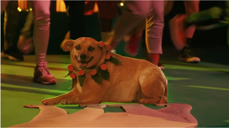
Figura 6: Imagem Vira-lata caramelo