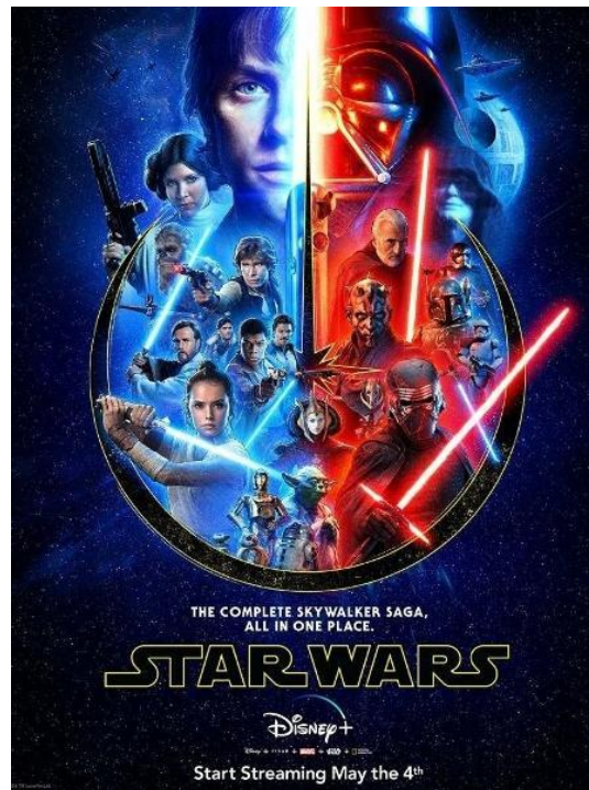
Figura 03: Pôster da Saga Skywalker.