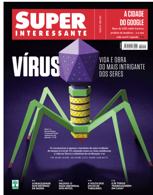
Figura 06: Capa da edição 414 da Revista Superinteressante