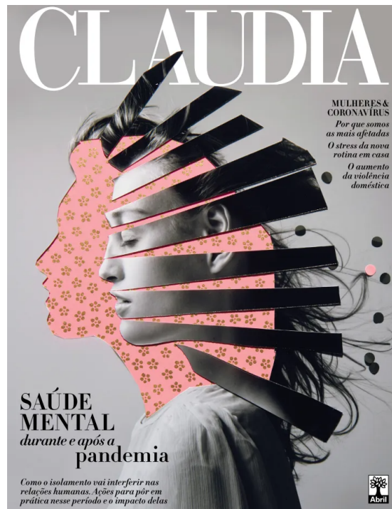
Figura 05: Capa da edição 703 da Revista CLAUDIA