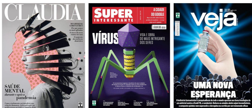
Figura 04: Capas das revistas analisadas. A) SUPERINTERESSANTE; B) CLAUDIA; C)VEJA.

A construção da identidade e do posicionamento sólido de uma marca pode levar tempo, dado que os consumidores precisam olhar e enxergar os propósitos, valores e pilares que a movem. Conforme enumera Telles (2004, p. 41), “a identidade de marca pode ser definida como o conjunto de associações que objetiva provocar sentido, finalidade e significado a uma determinada marca”. Neste sentido, os slogans desempenham papel essencial, dado que carregam essa essência de maneira concisa e em poucas palavras, assim como transmitem a proposta de valor, personalidade e missão. No mesmo sentido, a capa - por carregar os aspectos visuais - também estão atreladas à identidade de cada revista.